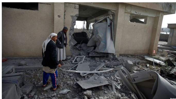
Obr. 3: Následky bombardování saúdským letectvem.

I navzdory tomu, že k embargu na Saúdskou Arábii vyzval Evropský parlament již v roce 2016, Česká republika ještě v roce 2017 této monarchii vyvezla zbraně a vojenský materiál v hodnotě 28 milionů eur. Za posledních pět