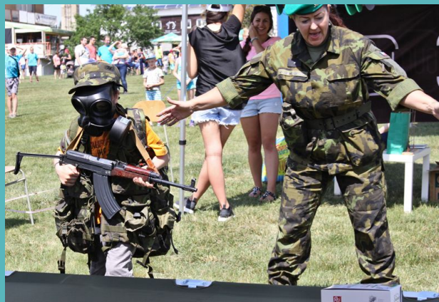
Obr. 4: Dětský den organizovaný radnicí městské části Brno-Medlánky.

Vývozy zbraní nejsou jediným problematickým aspektem současného vztahu české společnosti k militarismu – dalším je militarizace ve vzdělávání. Dětem jsou předkládány vojenské operace vedené se zbraněmi v rukou jako běžná součást průběhu konfliktů. Mírová řešení konfliktů tak mohou být upozaděna.